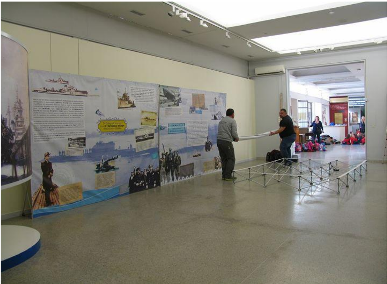
Στιγμιότυπα από το στήσιμο της έκθεσης στο Ναυτικό Μουσείο της Ελλάδος.